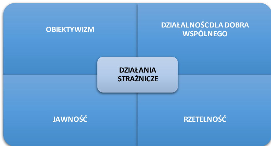
Rysunek 4. Cztery podstawowe zasady etyczne, które muszą spełniać działania strażnicze