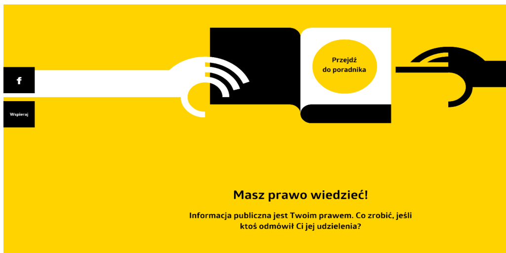
Rysunek 1. Przykład poradnika zawartego na stronie będącej centrum wiedzy o prawie do informacji, stworzone w 2006 roku przez Sieć Obywatelską Watchdog Polska

weryfikację informacji podawanych przez media, polityków i organy państwowe. „Watchdogi” zachęcają również obywateli do samodzielnego działania w kierunku pozyskania informacji. Wielokrotnie na ich stronach internetowych dostępne są poradniki jak postępować w sytuacji, gdy odmówiono nam dostępu do informacji.